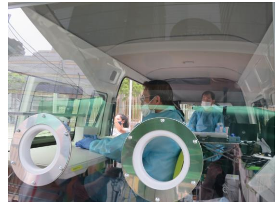
2021年6月末 新宿歌舞伎町における抗原検査デモの様子