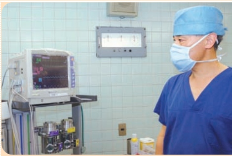
モニターを見ながら患者さんの体の様子をチェック