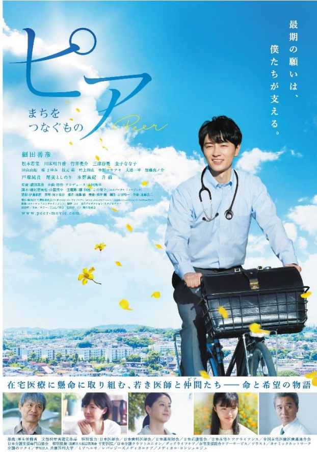
映画「ピア～まちをつなぐもの～」ポスター