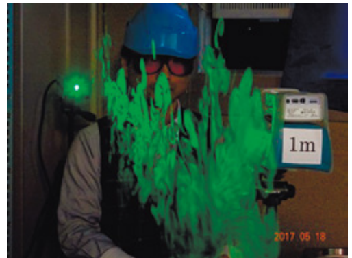
加熱式タバコを吸って吐き出された煙

1日の治療費は、医療費3割負担の方で230円程度。子ども達のために、禁煙にチャレンジしませんか？