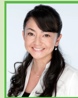
町 亜聖 氏 フリーアナウンサー 【全体司会兼任】